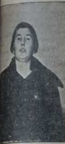
ALICIA MOREAU DE JUSTO

Se celebró, a las 21 horas, en el local del club Sportivo Italiano 2056, la tercera re-